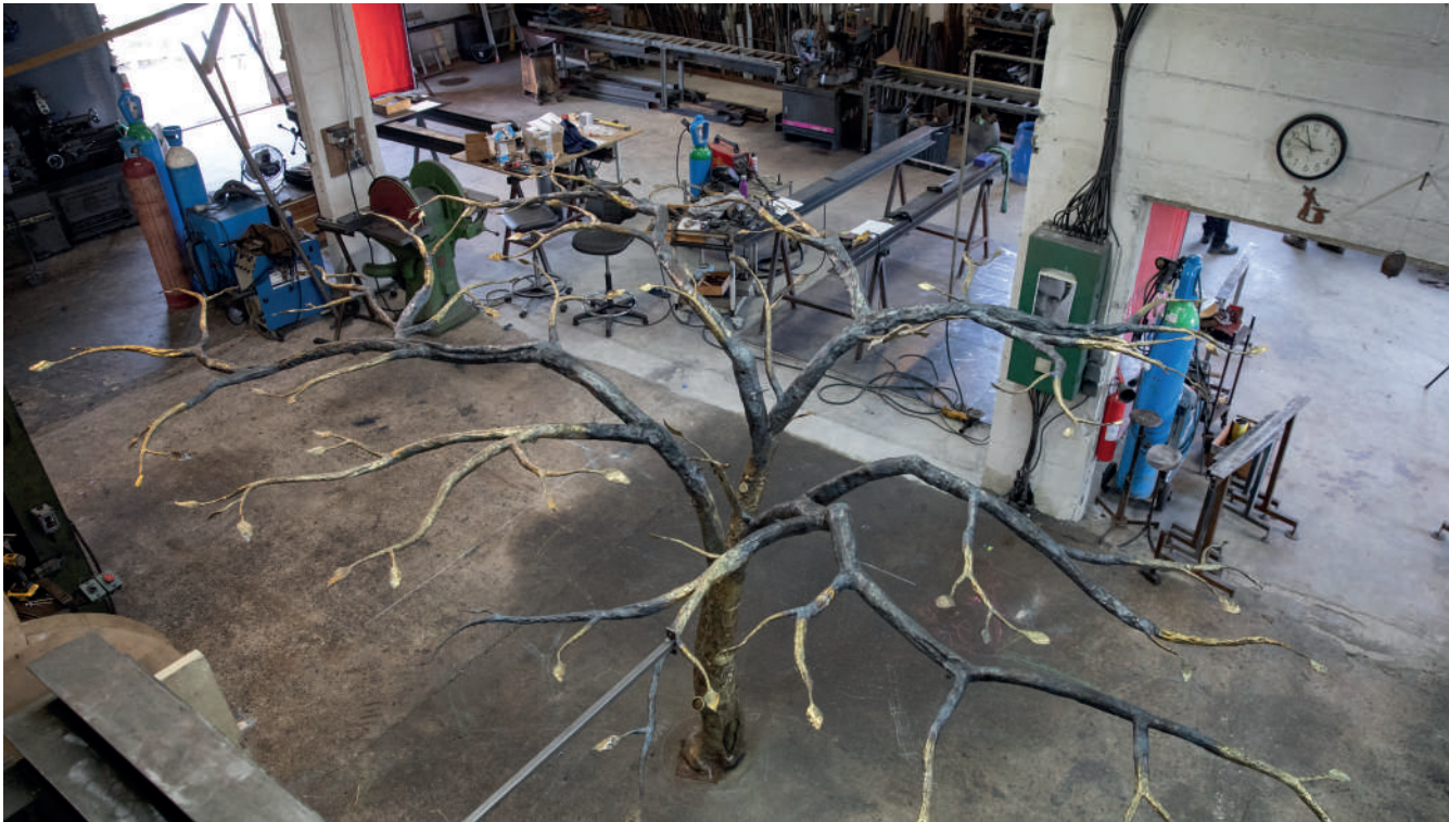
Arbre 220x360x420cm Acier 2022