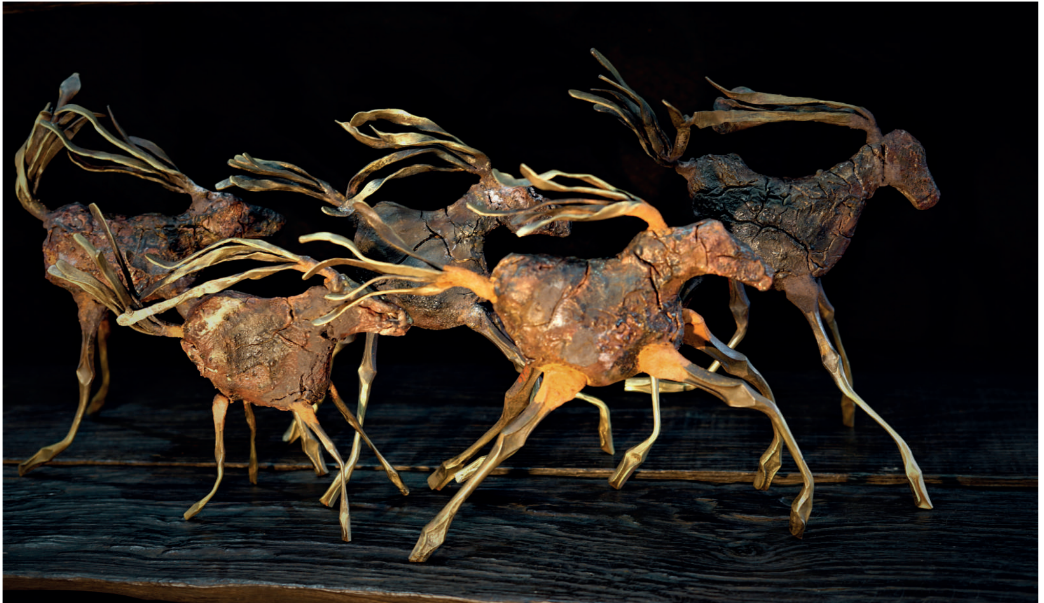
Cheval préhistorique acier, argile, émaux, minerai de fer 2022