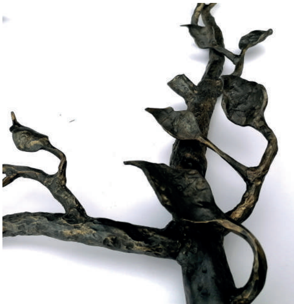
Cadre branche 65x45cm Acier 2022