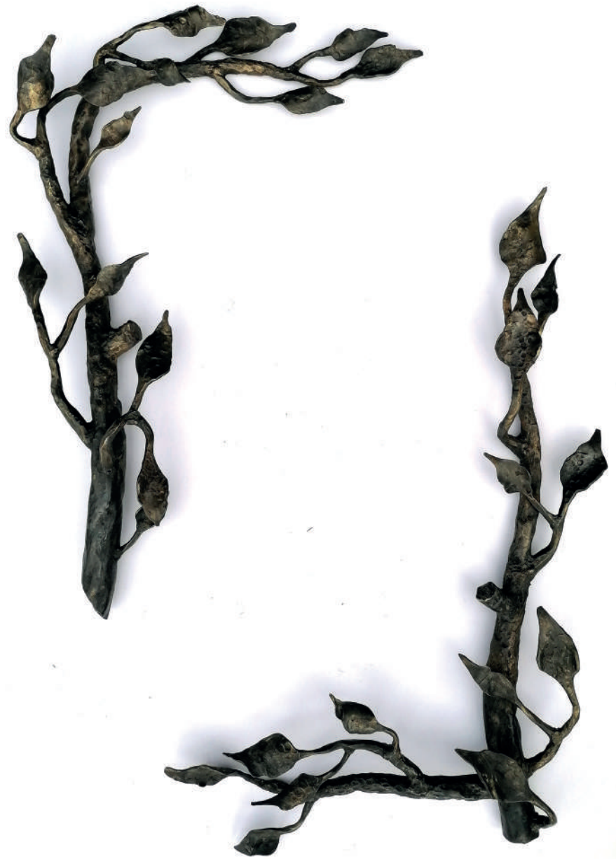
Branch frame 65x45cm Steel 2022