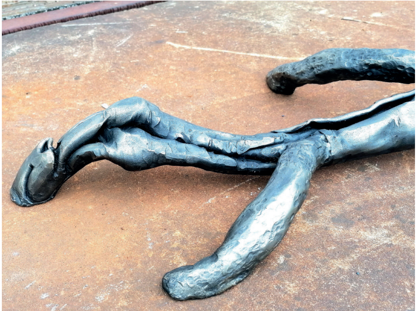
Tree Table 85x220x130cm Steel 2022