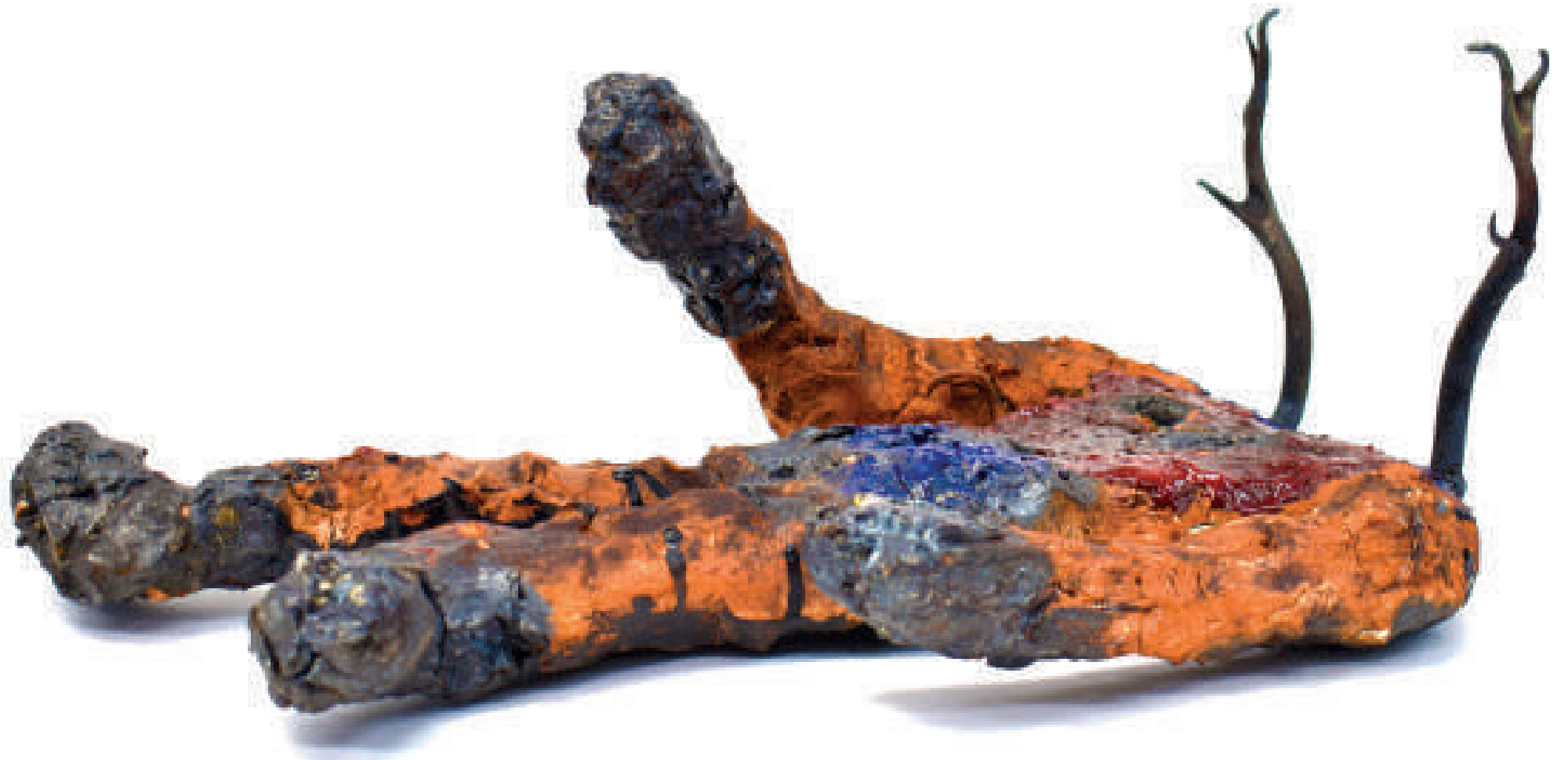
Forest entities 45 cm high Clay, iron ore, enamels 2020