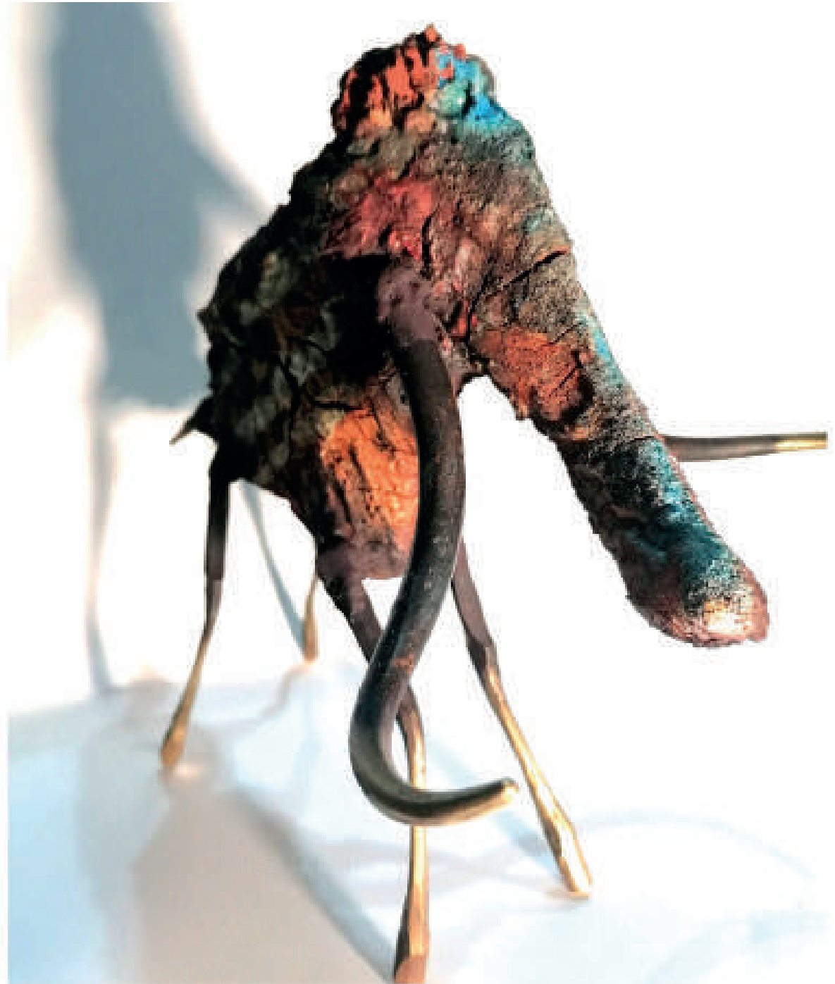
Prehistoric Mammoth steel, clay, enamels, iron ore 2022