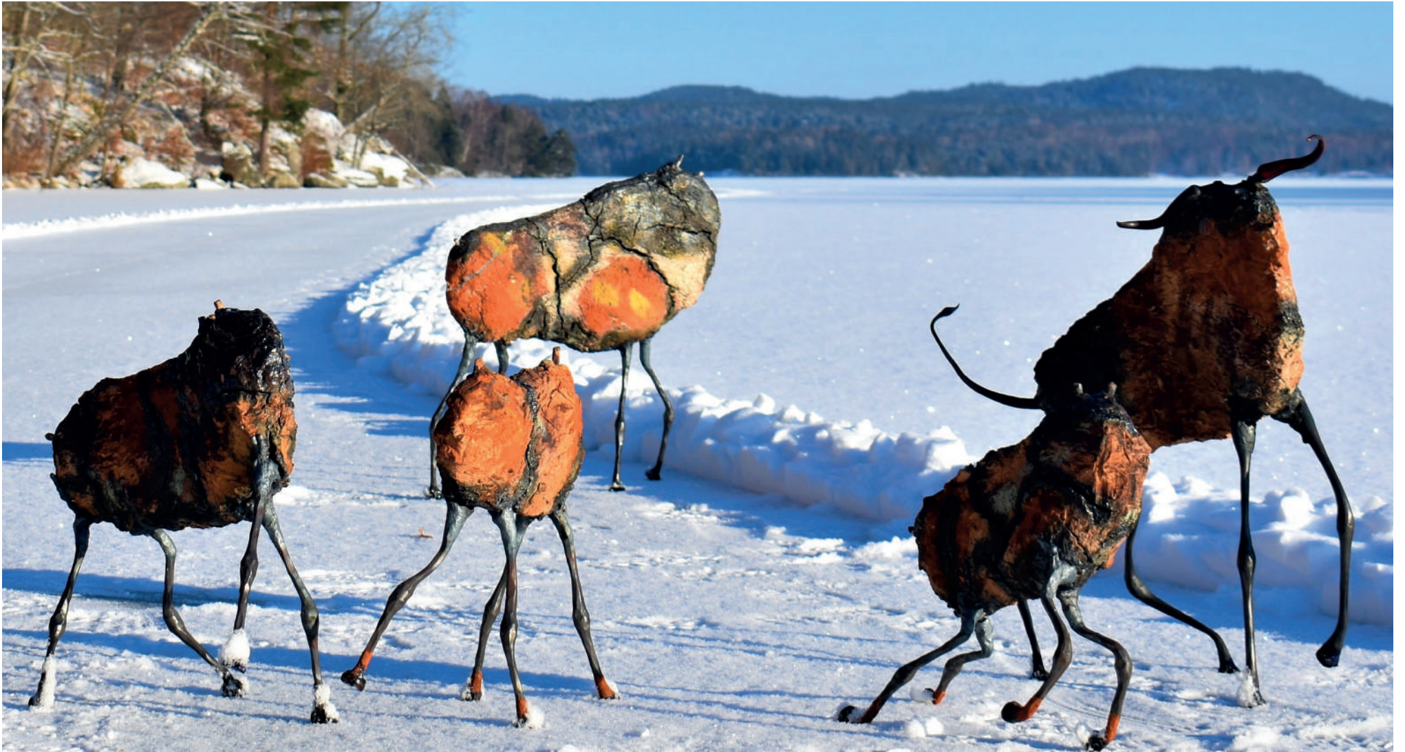
Bison herd steel, clay, enamels, iron ore 2021