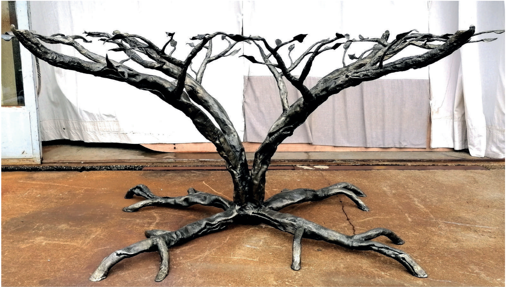
Table arbre 85x220x130cm Acier 2022