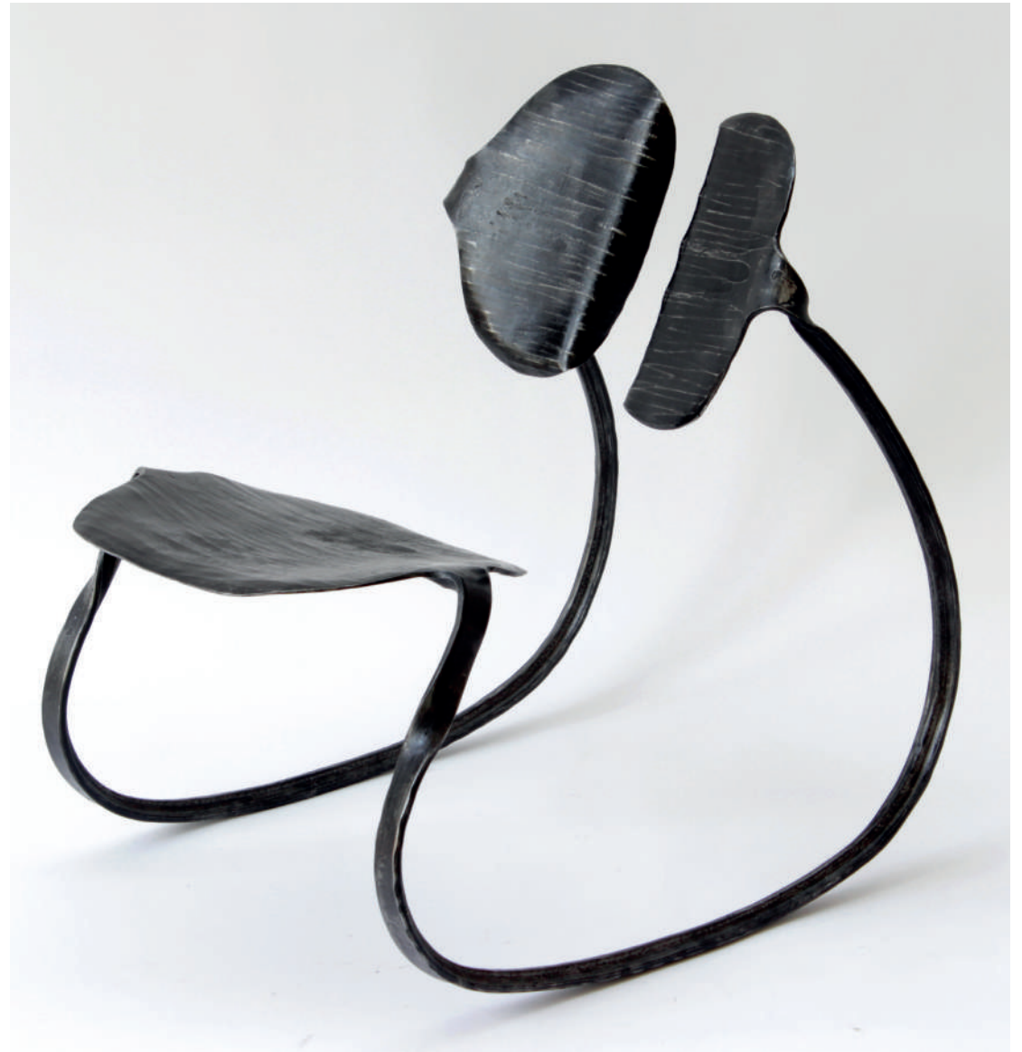
Water lily rocking chair 60 cm high and 70 com long Steel 2021