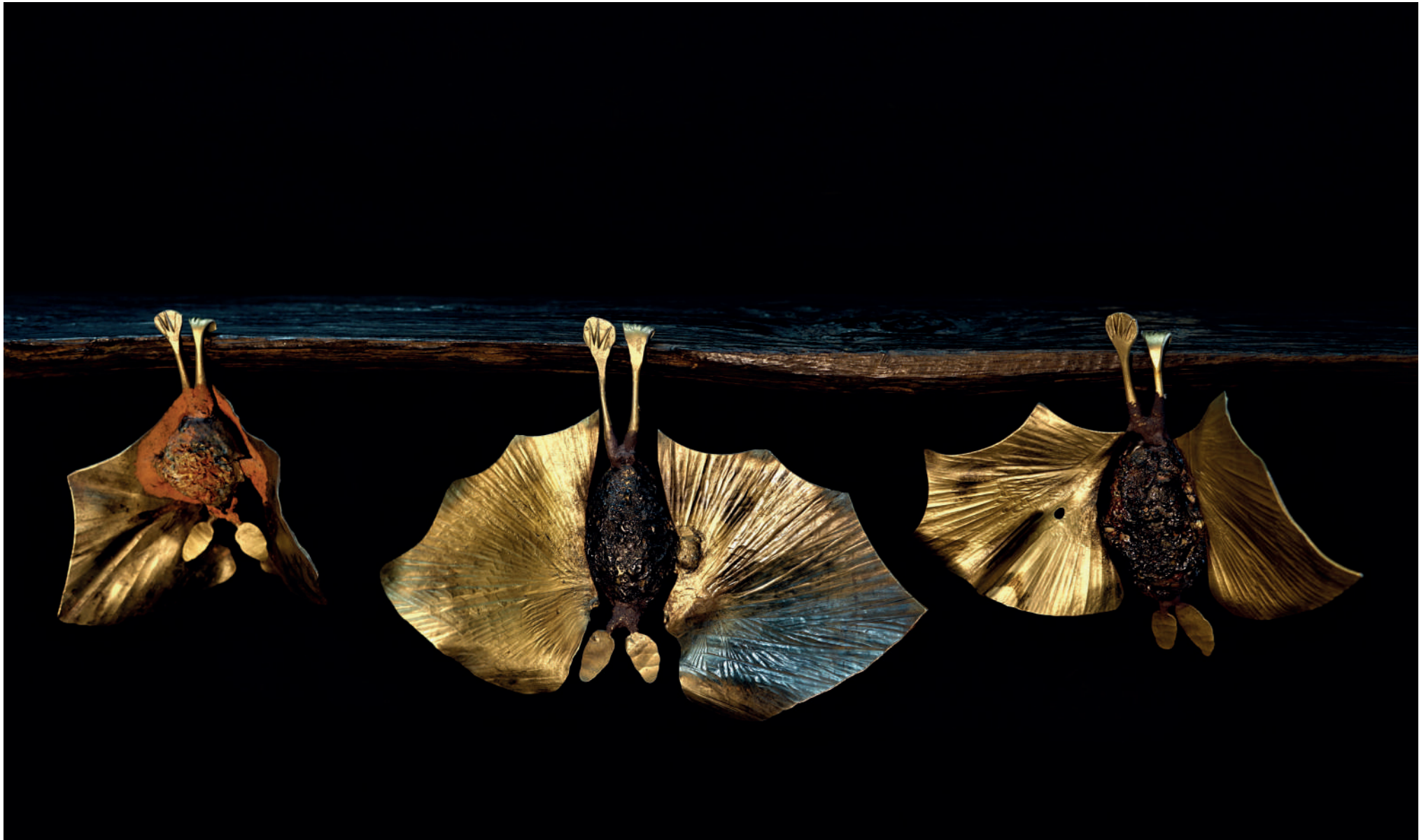
Chauves-souris préhistorique acier, argile, émaux, minerai de fer 2022