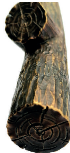
Bâton de maréchalbranche Branch Marshal's Staff